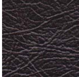
Col. Wine 8002

L'ETRUSCO rappresenta la rivisitazione dei tempi che furono, con il suo look molto Vintage si adatta perfettamente sia allo stile classico che moderno. Accuratamente trattato con cere e aniline pigmentate l'ETRUSCO si presenta come una pelle invecchiata e il suo effetto schiarente dona quelle particolari nuance tipiche delle pelli usurate dal tempo ma sempre affascinanti. Sia il processo di riconcia che la rifinitura dell'art. ETRUSCO sono fatti nel pieno rispetto dell'uomo e dell'ambiente.